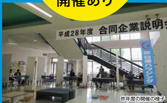
昨年度の開催の様子